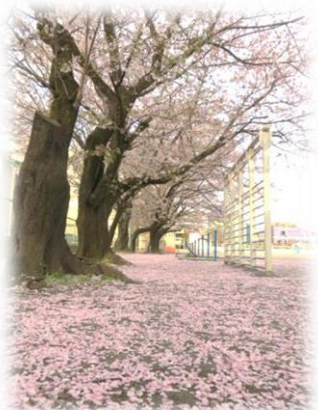
桜のじゅうたん。入学式・新年度まで花を咲かせてくれました