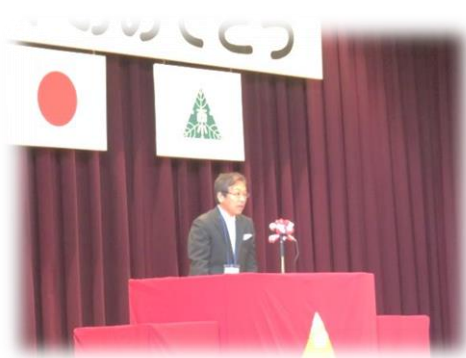
学校長式辞。一人ひとりが幸せになるためには、「寛容」の心が大切、と伝えました