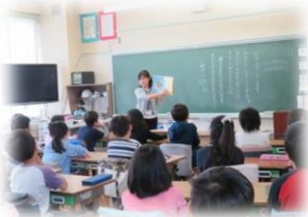
短い時間ですが、本の世界に浸ります。担任による読み聞かせを行う日もあります。