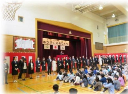
担任発表。新しい出会いを大切にします。どうぞよろしくお祈いします。