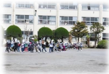
皆、整然と避難行動がとれました。おしゃべりがほとんどないことに、感心しました