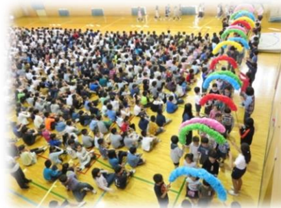
「わからないことは何でもぼくたちに聞いてください」・・・ここでも頼もしい上級生です