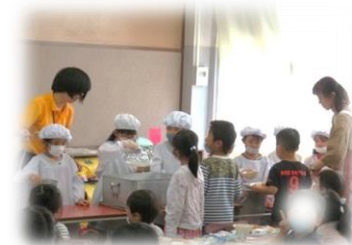
一つひとつついでに配膳を進めます。いただきますの前には、当番さんや調理員さんたちへのお礼の言葉も大切にしています